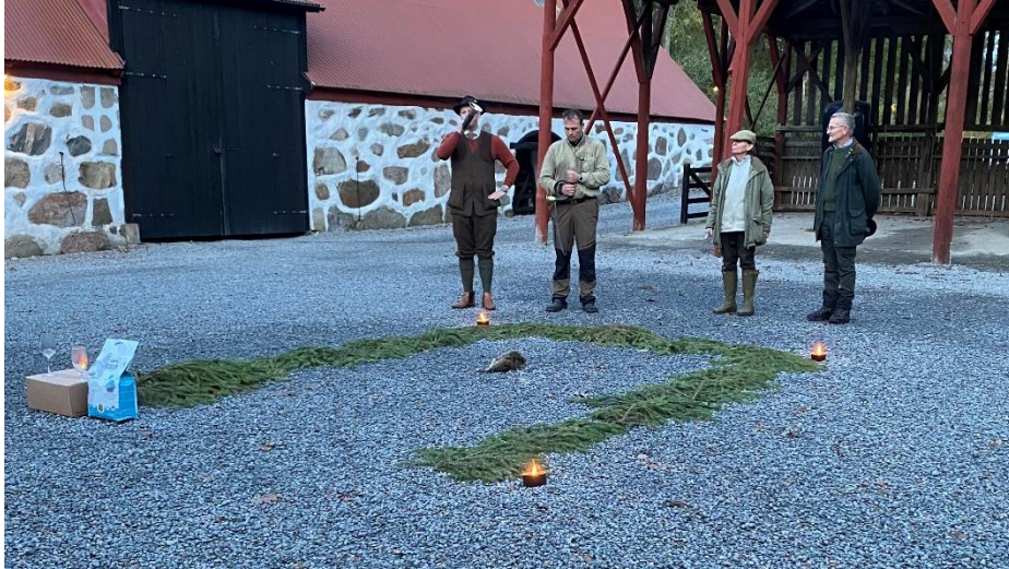
Hornblås vid viltparaden, här med några av markupplåtarna.