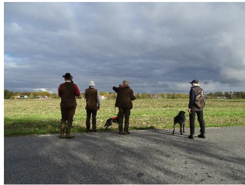
Publiken på fältet. Dags för släpp för Nonstop och Drilla.