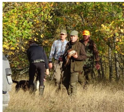
Fältarbetet respektive apportering av Epic.