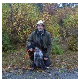
Sten & NonStop