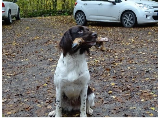
Samling inför smygjakten samt Pentax som hittat klöven på blodspåret.

Blodspåret kom härnäst och klockan var redan eftermiddag. Två ekipage skulle prövas som rapportörer. En tredje avböjde med hänsyn till att den inte hade poäng i alla tidigare moment samt att det när det var dags att spåra var det så mörkt i skogen att det inte gick att observera hunden.