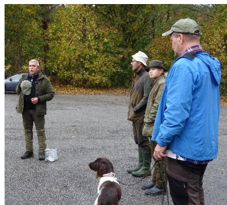
Genomgång inför vattenappen.