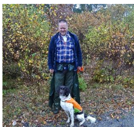
Björn & Pentax

Under en av de sista helgerna i oktober gick återigen ett fullbruksprov av stapeln i den Blekingska frodiga trädgården i höstfärger. Många var vi som nervöst kollade av väderapparna veckan innan och undrade hur det skulle gå, men vädergudarna var på vår sida och öppnade t o m för lite solsken vid söndagens fältmoment.