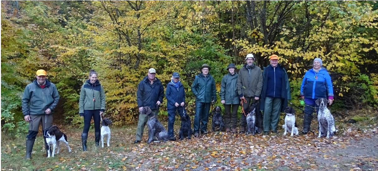
Provet's åtta ekipage (och en caddie) som kom till start.

Strax före skogsapporten, dagens första moment, hann vi fånga alla åtta deltagare på en gemensam bild i milt duggregn.