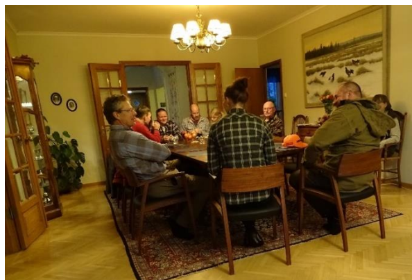
Förväntansfulla deltagare, domare och funktionärer dagen innan provet.

Lördagens startade i arla morgonstund med gemensam frukost, under tiden som funktionärerna med sina hundar vallade av marken inför kommande moment, så att alla skulle få samma förutsättningar.