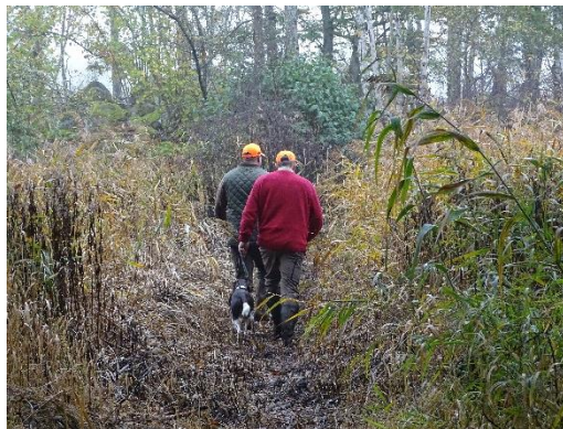
På väg ut till halvön. Niels med Pila.